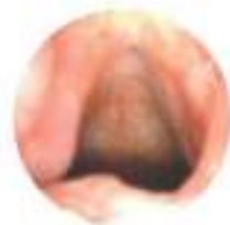
Follow-up a 11 mesi (dopo 4 procedure)