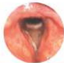
Carcinoma squamocellulare (T1a)