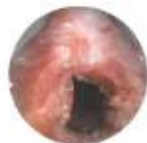
Dopo rimozione del papilloma (stenosi glottica evidente)