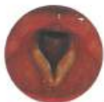
Follow-up a 3 mesi