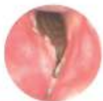
Carcinoma squamocellulare (T3)