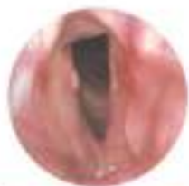
Follow-up a 6 mesi