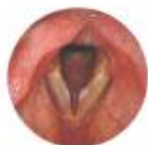
Polipo corda vocale sinistra