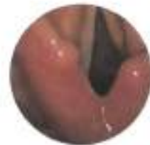
Follow-up a 6 mesi