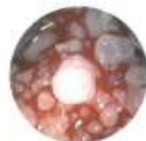
Papilomatosi respiratoria ricorrente