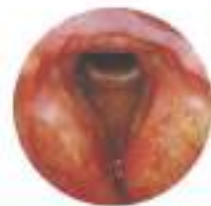
Follow-up a 12 mesi