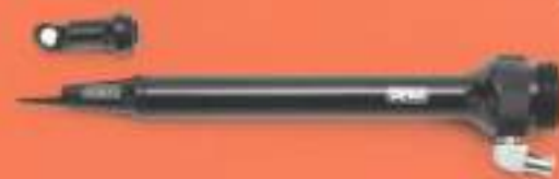
Manipolo da taglio "CUT SLIM"