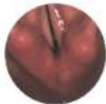
Paralisi bilaterale delle corde vocali (dopo tireoidectomia totale)